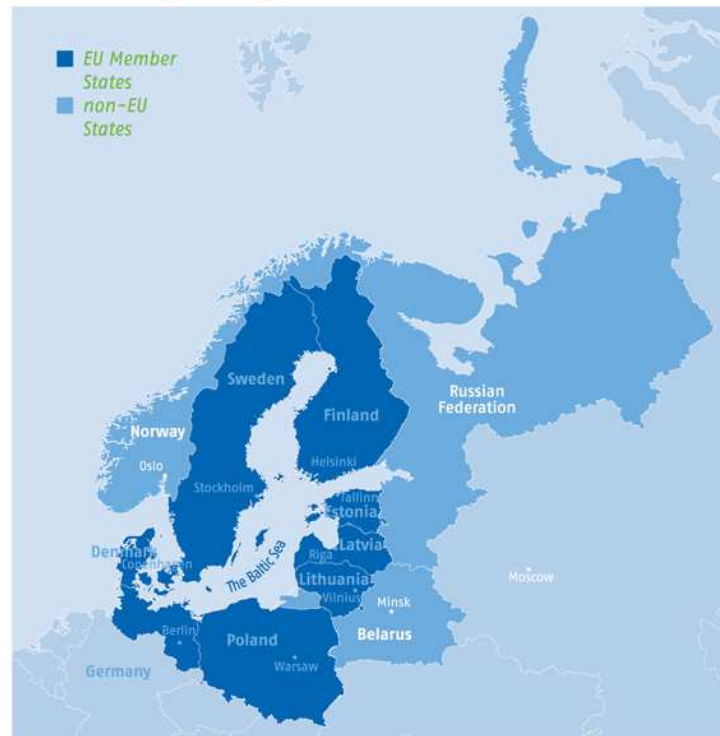
Cross-Border Programmes in the Baltic Sea Region* 2007 - 2013